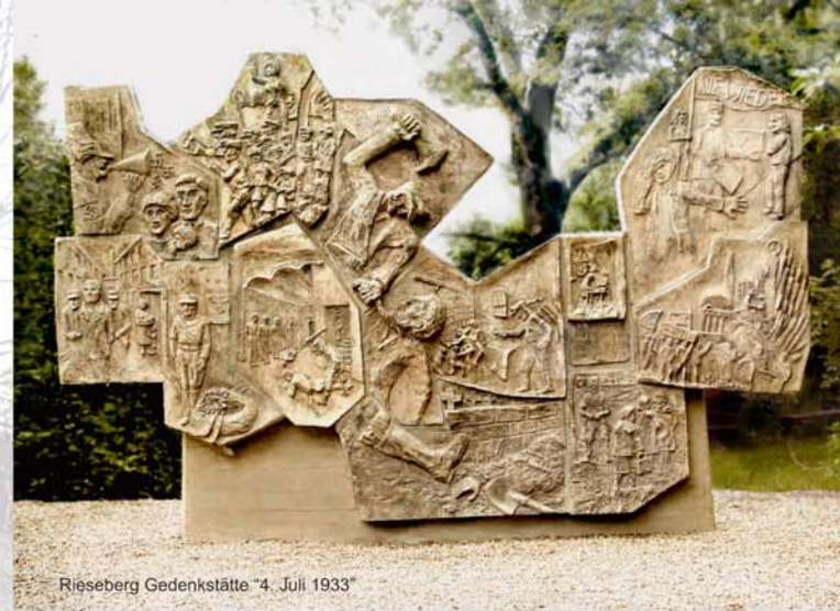
Rieseberg Gedenkstätte "4. Juli 1933"